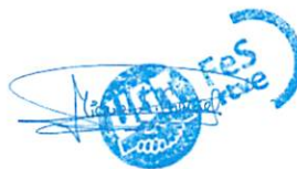
Miguel Ángel Curieses Gaité Swcretario General de UGT en CRTVE

Sin otro particular reciban un cordial saludo